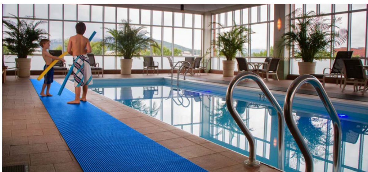
Wetmat installé dans la piscine intérieure d'un hôtel en Alsace (France)