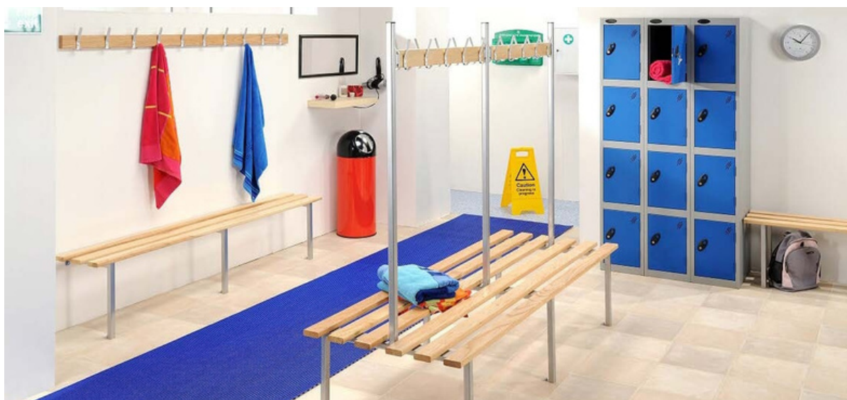
Wetmat installé dans un vestiaire à St Nicolas de Port (France)